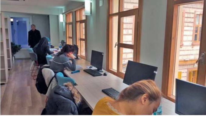
Şekil 9. Buca Belediyesi Halk Kütüphanesi, 2016

edebiyata pek çok alana ilişkin bilgi kaynakları yer almaktadır. Kütüphanede tamamında internet erişiminin olduğu altı bilgisayar kullanıcıların hizmetine sunulmuş durumdadır. Bu bilgisayarlardan bir tanesi görme engelliler için özel donanımı olan ve yalnız görme engellilerin kullanımına ayrılmış bilgisayardır.