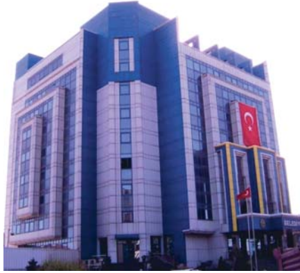
Şekil 6. Buca Belediyesi Binası

Cumhuriyetin ile birlikte belediye statüsü kazanmış olan Buca, 1987 yılında yürürlüğe giren 3392 sayılı yasa ile ilçe olmuştur. 3 köyü ve bir beldesi olan kentin yüzölçümü 134 km 2 'dir. Adrese Dayalı Nüfus Kayıt Sistemi 2015 yılı sonuçlarına göre nüfusu 470.768 5 olan Buca'da %99'luk bir okuryazar oranı vardır. 39 yıllık bir tecrübe ile kendisine bağlı 39 merkez mahalle ve 4 taşra muhtarlığı ile vatandaşlarına hizmet veren Buca Belediyesinin hizmet alanı içerisinde ülkemizin köklü üniversitelerinden biri olan Dokuz Eylül Üniversitesi merkez kampüsü ve kampüs dışında konuşlanan Eğitim, Hukuk, İktisat ve İşletme Fakülteleri de yer almaktadır.