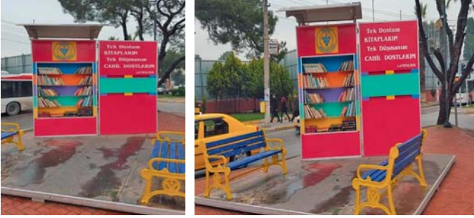
Şekil 15. Buca Belediyesi Sokak Kitaplığı, 2016

Buca Belediyesi'nin belli aralıklarla ünlü yazarları Bucalı vatandaşlarla bir araya getirmeyi hedeflediği "Kitap Kulübü" projesi 2015 yılı ile birlikte belediyenin bilgi ve kültür hizmetleri arasındaki yerini almıştır. Kitap Kulübünün ilk konuğu aynı yılın Şubat ayı içinde kent sakinleri ile buluşan usta öykü ve roman yazarı İnci Aral olmuştur. Buca Belediyesi Olimpik Yüzme Havuzu Konferans Salonu'nda gerçekleştirilen söyleşiye kent sakinleri büyük ilgi göstermiştir. Kitap Kulübü etkinliğinin ikincisine yazar Seda Diker, üçüncüsüne de edebiyatçı Murathan Mungan konuk olarak davet edilmiştir. Kent sakinlerinin tüm konuklara büyük ilgi gösterdiği kitap kulübü projesi uzun soluklu olması amaçlanan etkinlikleri arasındaki yerini almıştır.