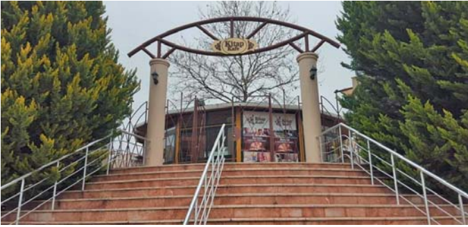
Şekil 11. Buca Belediyesi Kitap Kafe, 2016

Kitap ve kütüphane hizmetlerine ilişkin misyonun “kitap ve kitap okuma konusunda farkındalık yaratmak için sokağa ve sokaktaki insana dokunmak, o insanın da kitaba dokunmasını sağlamak gerekir” biçiminde ortaya konulduğu Buca Belediyesinde bu doğrultuda verilen hizmetlerden bir diğeri de aynı yerde hizmet veren Mini Sahaflar Sokağı ile Kitap Kafedir. Kısa sürede şehrin kitap okuma merkezleri arasındaki yerini alan sokak ve kafe, kentin sayfiye yerlerinden biri olan Yedigöller’de, haftanın her günü kent sakinlerine hizmet vermektedir.