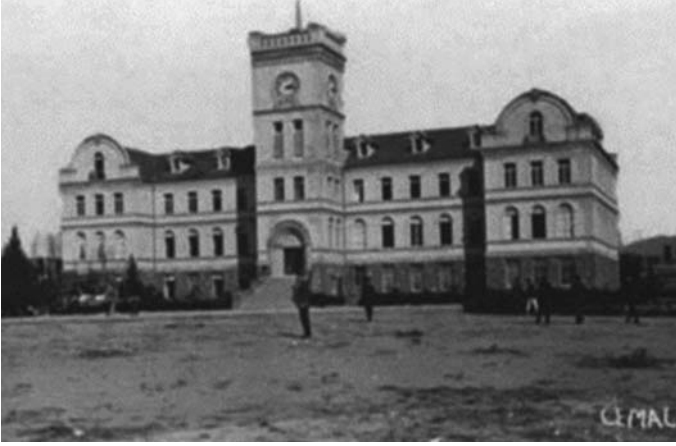
Şekil 4. Eski Amerikan Koleji Saat Kulesi (IZTO, 2016)

19'uncu yüzyılın ikinci çeyreği ile birlikte Balkanlarda yaşanan milliyetçilik akımı ve Türk vatandaşların Anadolu'ya zorunlu göçü ile Türk popülasyonu artan İzmir ve Buca'daki nüfus dengesi, Balkan Savaşlarının ardından Levantenlerin aleyhine biraz daha değişmiştir (Buca Belediyesi, 2016). I. Dünya Savaşı ve Kurtuluş Savaşının sıcak ve sürekli eylem merkezlerinden biri olan İzmir, İstanbul ve Ankara ile birlikte Cumhuriyet dönemi Türkiye'sinin de sosyal, siyasi ve ekonomik seyrini doğrudan belirleyen kenttir. Bu apolet, şehrin en kalabalık iki ilçesinden biri olan Buca'ya da hem farklı fırsat ve olanaklar hem de çeşitli sorumluluk ve görevler getirmektedir.