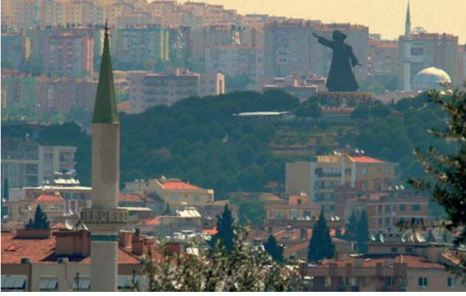
Şekil 5. Buca'dan Bir Enstantane, 2015

Cumhuriyetin ile birlikte belediye statüsü kazanmış olan Buca, 1987 yılında yürürlüğe giren 3392 sayılı yasa ile ilçe olmuştur. 3 köyü ve bir beldesi olan kentin yüzölçümü 134 km 2 'dir. Adrese Dayalı Nüfus Kayıt Sistemi 2015 yılı sonuçlarına göre nüfusu 470.768 5 olan Buca'da %99'luk bir okuryazar oranı vardır. 39 yıllık bir tecrübe ile kendisine bağlı 39 merkez mahalle ve 4 taşra muhtarlığı ile vatandaşlarına hizmet veren Buca Belediyesinin hizmet alanı içerisinde ülkemizin köklü üniversitelerinden biri olan Dokuz Eylül Üniversitesi merkez kampüsü ve kampüs dışında konuşlanan Eğitim, Hukuk, İktisat ve İşletme Fakülteleri de yer almaktadır.