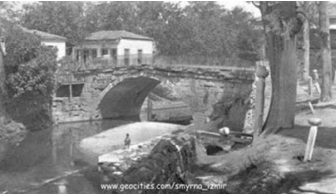
Şekil 2. Buca Kervan Köprüsü (İzmir Valiliği, 2016)

Kral Yolu güzergâhının bir parçası olan İzmir, 17'nci yüzyılda Anadolu'ya gelen Uzak ve Ortadoğu bağlantılı kervan ticaret yollarının son durağı haline gelmiştir (Bauden, 2003; İzmir Valiliği, 2016). O zamana kadar Rumların ağırlıkta olduğu orta ölçekli bir Ege köyü olarak kalan, sakinlerinin tarımla, özellikle de bağcılıkla ilgilendiği Buca İzmir'in parlayan yıldızına dönüşmeye başlamıştır (Şenyapılı, 2005, s. 27).