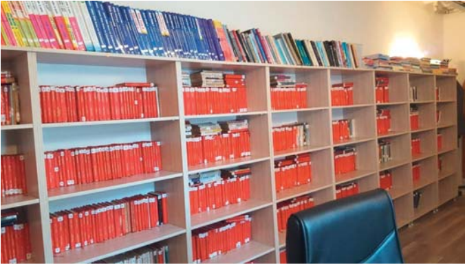
Şekil 8. Buca Belediyesi Halk Kütüphanesi, 2016

Belediye kütüphane hizmetlerinin merkezinde yer alan halk kütüphanesi 1989 yılında belediye ile birlikte faaliyete geçtiğinde 3 bin kitaplık bir koleksiyona sahiptir. Günümüzde kütüphanenin dermesi yaklaşık 22 bin kitaptan oluşmaktadır. Kütüphane raflarında 9 bin kitap okura sunulurken, görece daha az tercih edilen 12 bin kitap şu an için depoda tutulmaktadır. Yetkililerle yapılan görüşmede, bu kitapların başta eğitim kurumları olmak üzere gereksinimi olan kurum ve kuruluşlara bağışlanmasına ilişkin protokol çalışmalarının devam ettiği bilgisi verilmiştir.