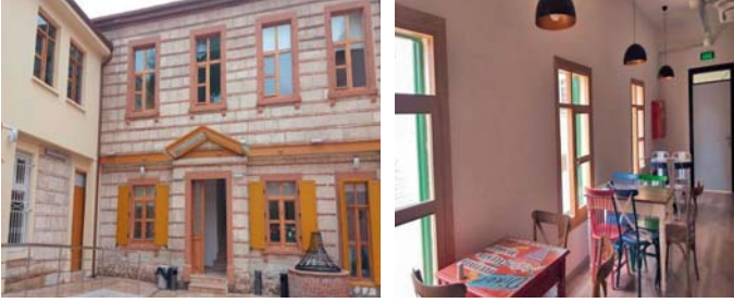
Şekil 10. Halk Kütüphanesine katılması düşünülen kafeterya, 2016

Kitap ve kütüphane hizmetlerine ilişkin misyonun “kitap ve kitap okuma konusunda farkındalık yaratmak için sokağa ve sokaktaki insana dokunmak, o insanın da kitaba dokunmasını sağlamak gerekir” biçiminde ortaya konulduğu Buca Belediyesinde bu doğrultuda verilen hizmetlerden bir diğeri de aynı yerde hizmet veren Mini Sahaflar Sokağı ile Kitap Kafedir. Kısa sürede şehrin kitap okuma merkezleri arasındaki yerini alan sokak ve kafe, kentin sayfiye yerlerinden biri olan Yedigöller’de, haftanın her günü kent sakinlerine hizmet vermektedir.