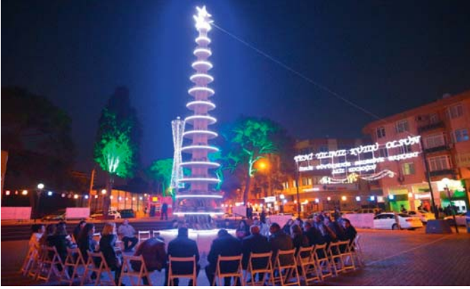
Şekil 14. Çevik Bir Meydanı Yılbaşı Kitap Ağacı, 2016

Bucalılar tarafından ilgiyle karşılanmış ve 2 saat içinde kitap ağacında tek kitap kalmamıştır. Bu yoğun ilgi nedeniyle belediye tarafından kitap ağacı etkinliğinin sürekli faaliyetler kapsamına alınması ve her yılbaşında tekrarlanması kararı alınmıştır (Buca Belediyesi, 2016).