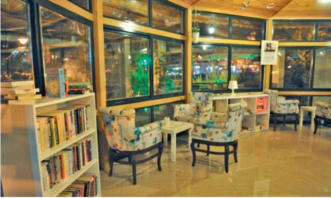
Şekil 13. Buca Belediyesi Kitap Kafe, 2016

Kent sakinlerinin bir şeyler yiyip içerken aynı zamanda kitap okuyabildikleri kitap kafenin müdavimleri arasında çocuklardan ev hanımlarına, üniversite öğrencilerinden bölge esnafına kadar farklı demografik özelliklerde okurlar yer almaktadır. Yaklaşık 2 yıldır hizmet veren sahaflar sokağı duyarlı vatandaşların bağışları ile dermesini her geçen gün arttırmaya devam etmektedir.