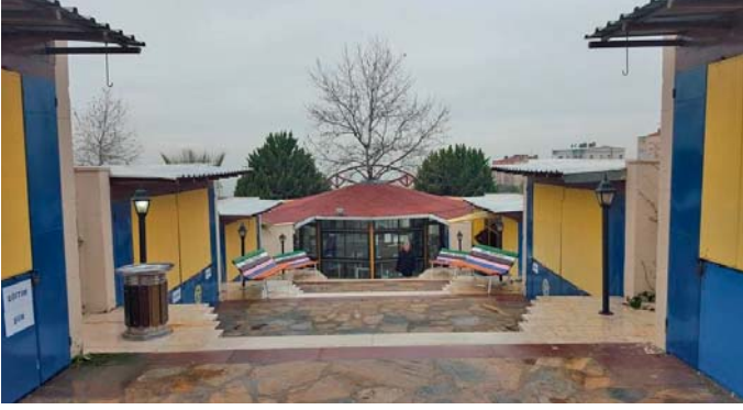
Şekil 12. Buca Belediyesi Küçük Sahaflar Sokağı, 2016

Kent sakinlerinin bir şeyler yiyip içerken aynı zamanda kitap okuyabildikleri kitap kafenin müdavimleri arasında çocuklardan ev hanımlarına, üniversite öğrencilerinden bölge esnafına kadar farklı demografik özelliklerde okurlar yer almaktadır. Yaklaşık 2 yıldır hizmet veren sahaflar sokağı duyarlı vatandaşların bağışları ile dermesini her geçen gün arttırmaya devam etmektedir.