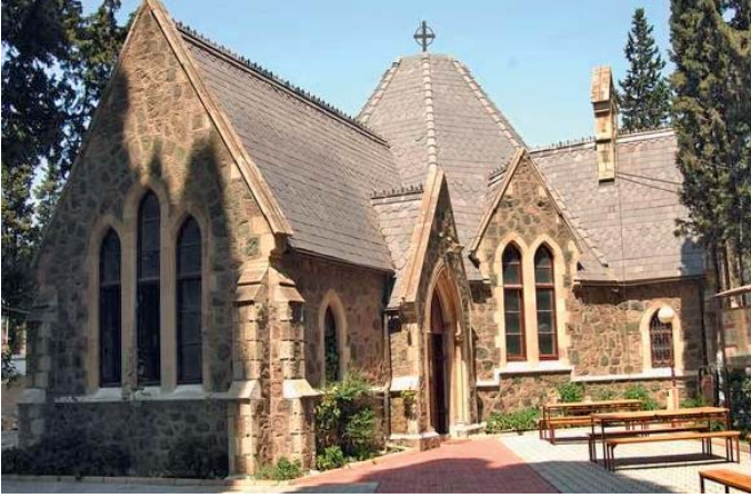
Şekil 3. 1834 yılında açılan Buca All Saints British Protestan Kilisesi (Buca Belediyesi, 2016)

yanı sıra Osmanlı'da ticaret ile uğraşmak için aileleri ile birlikte Avrupa'dan gelen tüccarların bölgeye yerleşmeye başlaması da etkili olmuştur. Yaşanan bu değişimle birlikte Buca'da ortaya çıkan dini ve kültürel çeşitlilik Cumhuriyet'in ilk yıllarına, hatta 20'inci yüzyılın ikinci yarısına kadar korunmuştur. Günümüzde dahi Buca'da bu renkliliğin izlerini görmek olanaklıdır. Çok kültürlü bu toplum içerisinde nüfus ve etkinlik açısından ön plana çıkan grup ise İngiliz vatandaşlarıdır.