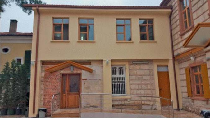
Şekil 7. Buca Belediyesi Halk Kütüphanesi, 2016

Belediye kütüphane hizmetlerinin merkezinde yer alan halk kütüphanesi 1989 yılında belediye ile birlikte faaliyete geçtiğinde 3 bin kitaplık bir koleksiyona sahiptir. Günümüzde kütüphanenin dermesi yaklaşık 22 bin kitaptan oluşmaktadır. Kütüphane raflarında 9 bin kitap okura sunulurken, görece daha az tercih edilen 12 bin kitap şu an için depoda tutulmaktadır. Yetkililerle yapılan görüşmede, bu kitapların başta eğitim kurumları olmak üzere gereksinimi olan kurum ve kuruluşlara bağışlanmasına ilişkin protokol çalışmalarının devam ettiği bilgisi verilmiştir.