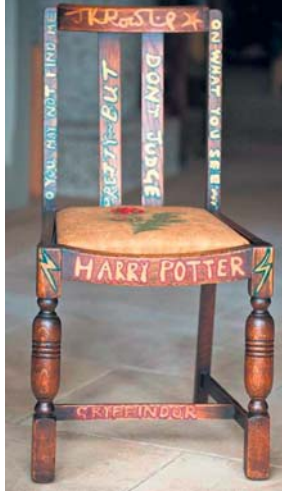
Şekil 4. Özel Arşiv Materyali Örneği

2 Şubat 2012 tarihli Hürriyet Gazetesi'nde; dünyaca ünlü film yönetmeni Steven Spielberg'in 7 Oscar ödüllü "Schindler'in Listesi" filmine de kaynaklık eden arşivini Londra Üniversitesi Soykırım Araştırmaları Merkezi'ne bağışladığını konu alan haber özel arşivlerin sahipleri tarafından yapılan bağışa çarpıcı bir örnek olarak gösterilebilir.