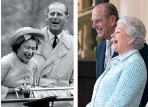
Şekil 5. Özel Arşiv Materyaline İlişkin Örnek Habere İle İlgili Fotoğraflar

Yine yakın tarihte "Harry Potter"ın yazarı J.K. Rowling'in üzerinde eseri yazdığı ahşap sandalyenin New York'taki müzayede de 400 bin dolara satıldığı" haberi görsel medyadan duyurulmuştur. Bu haberler özel arşiv belgelerinin ulaşabileceği maddi değere çarpıcı örnekler olarak verilebilir.