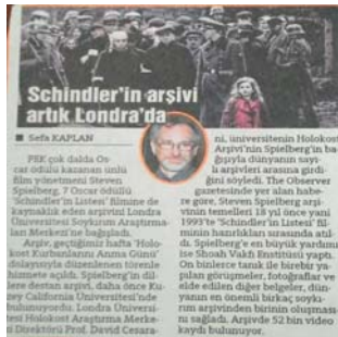
Şekil 3. Özel Arşiv Materyaline İlişkin Örnek Haber

14.06.2015 tarihli Habertürk ve 12.06.2015 tarihli Cumhuriyet gazetelerinde ise Nobel Ödüllü Alman fizikçi Albert Einstein’ın 27 adet mektubunun Los Angeles kentindeki açık artırmada 420 bin dolara satıldığından bahsetmektedir.