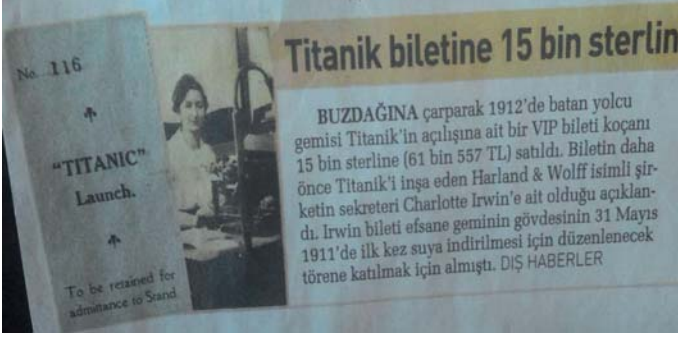
Şekil 6. Özel Arşiv Materyaline İlişkin Örnek Haber

26 Nisan 2016 tarihli Hürriyet gazetesine haberinde Kraliçe'nin aşk mektubuna 60 bin TL.