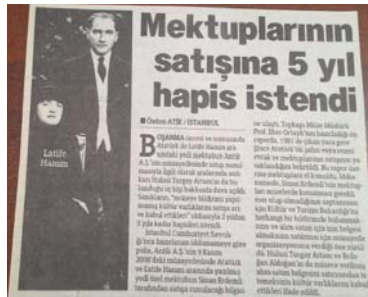
Şekil 1. Özel Arşiv Materyaline İlişkin Örnek Haber

Özel Arşiv ile ilgili medyaya yansıyan haberlerden birkaç akılda kalıcı örnek: